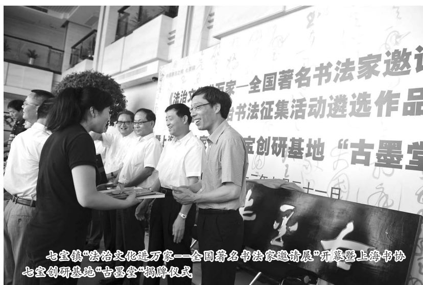
七宝镇“法治文化进万家——全国著名书法家邀请展”开幕式上海书协七宝镇创作基地“古墨堂”揭牌仪式

千年古镇墨韵悠长，新传今日又谱新篇。经济大发展的七宝镇，在“中国书法之乡”的荣誉前不会止步，更不会骄傲，将继续书写七宝“文化大镇”的锦绣篇章。