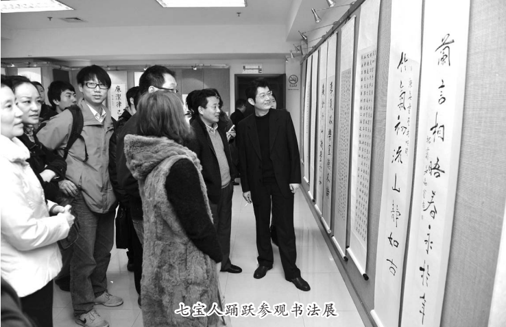
七宝人踊跃参观书法展

“金描吴越经”即指吴越王赐予七宝寺的《金字莲花经》书法长卷。现在，这部距今1000多年的小楷经典被定为国家一级文物，珍藏于上海历史博物馆。