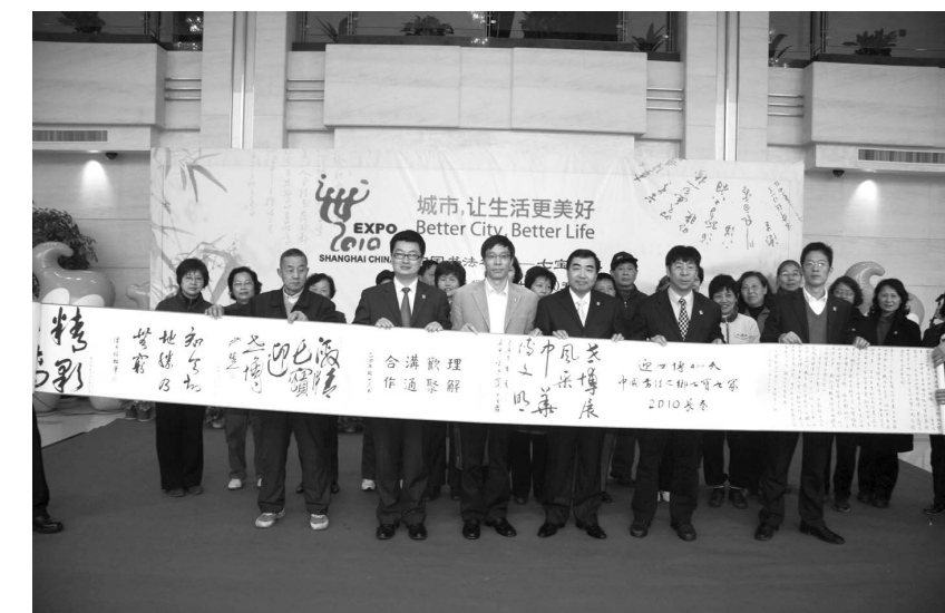
七宝镇 2010 书法长卷敬献上海世博局仪式

2000年，七宝镇按照“传承优秀历史文化遗产，保护修复街内旧有建筑物，再现老街独特人文景观和个性”的原则，对七宝镇老街进行修复改造。这条曾被专家称作“中国古代城镇规划史上一块活化石”的街道，全长360多米，是离上海中心城区最近、明清风格最为贴近完好的老街。如今，保持古