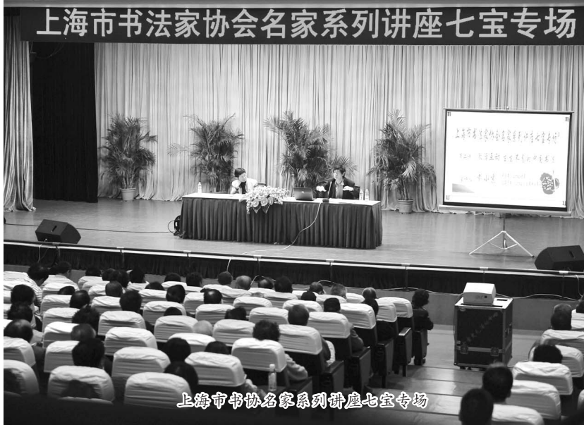
上海市书法家协会名家系列讲座七宝专场