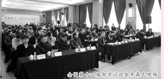
全国第十一届书学讨论会开幕式现场