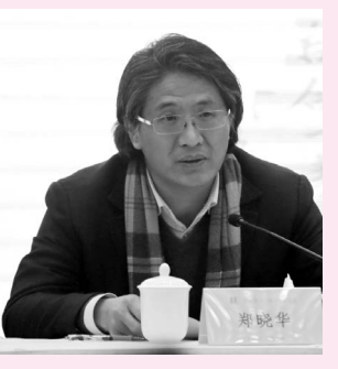
中国书协分党组书记、秘书长 郑晓华