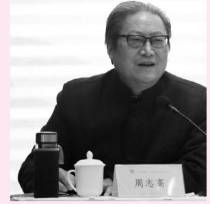
上海书协主席 周志高