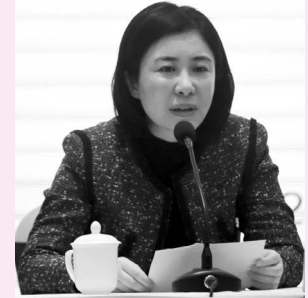
中共上海浦东新区区委宣传部副部长、文广局局长 黄玮