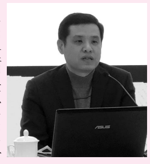
中国文联理论研究室副主任 徐粤春