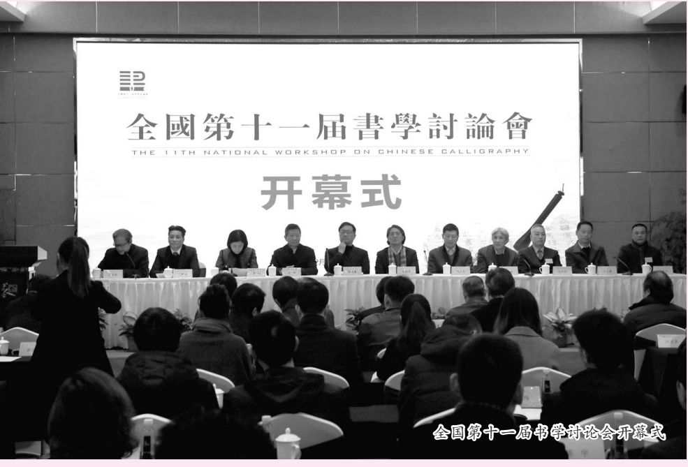
全国第十一届书学讨论会开幕式

最后,还有一句张横渠的老话,“为天地立心,为生民立命”,这两句我们今天暂不作为重点;第三句“为往圣继绝学”。书法在我们现在的信息网络时代来说,可能会成为“绝学”,所以强调要“继”。最后一句“为万世开太平”。“万世”不敢当,太大了。我们希望,以书法为自己的使命,为下一代(下一世)的人找研究方向,预测可能“开”什么样的“太平”?目前还不知道,但肯定要有一个“开太平”的愿景! (整理:陈晓)