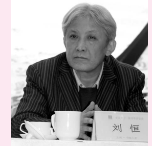
中国文联书法艺术中心主任 刘恒