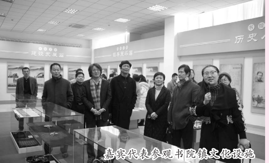
嘉宾代表参观书院镇文化设施