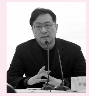
中国文联副主席、中国书协主席、中国书协学术委员会主任 陈振濂